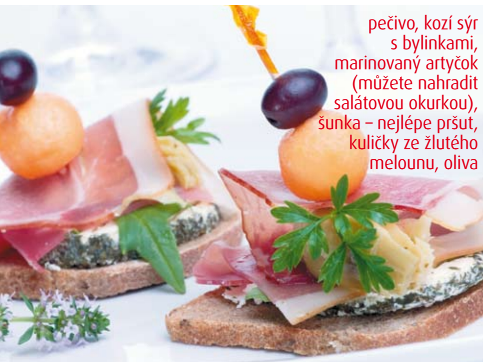
pečivo, kozí sýr s bylinkami, marinovaný artyčok (můžete nahradit salátovou okurkou), šunka – nejlépe pršut, kuličky ze žlutého melounu, oliva