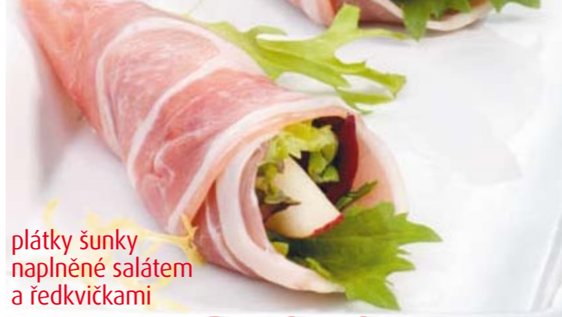
plátky šunky naplněné salátem a ředkvičkami