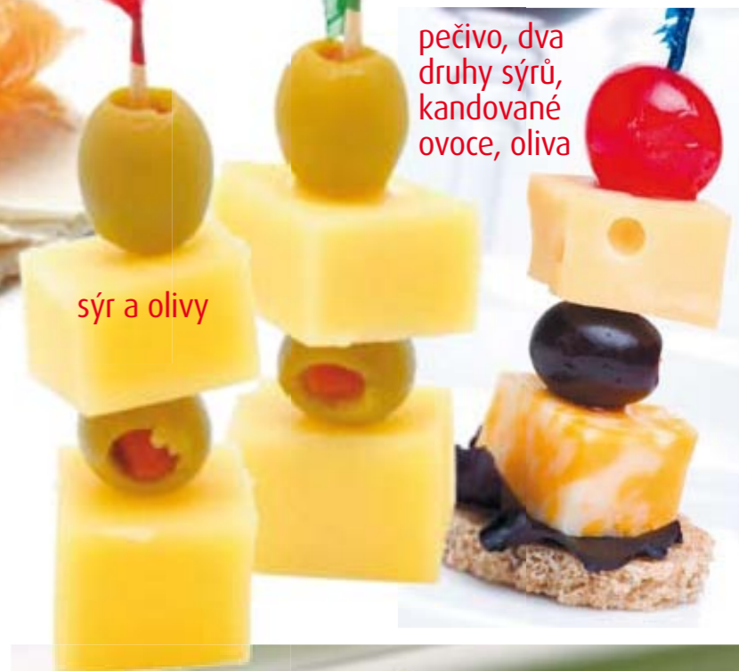
pečivo, dva druhy sýrů, kandované ovoce, oliva