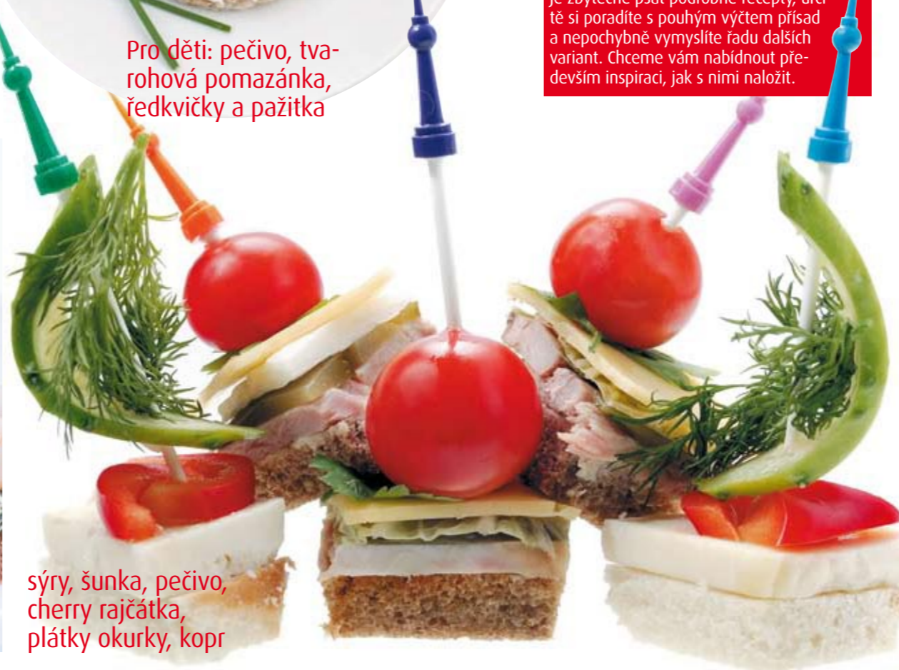
sýry, šunka, pečivo, cherry rajčátka, plátky okurky, kopr