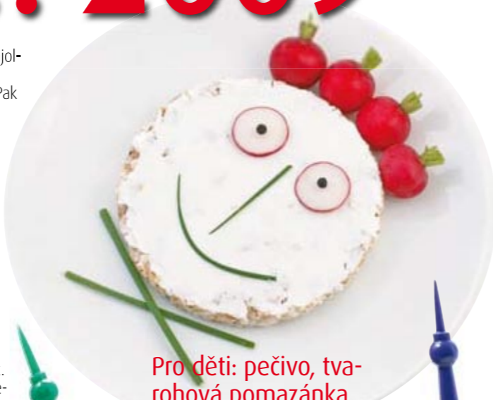
Pro děti: pečivo, tvarohová pomazánka, ředkvičky a pažitka

Tvaroh se sýrem a majolkou našlehejte ručním ponorným mixérem. Pak pomazánku rozdělte na pět částí a do každé z nich zašlehejte jinou příchuť. Vznikne tak pět barevných variant, každá jinak chutná (podle chuti ještě přisolte nebo přidejte chilli nebo pepř). Pomazánku můžete servírovat v pěti miskách jako dip – pak na mísu vedle přidejte na proužky nakrájenou mrkev, ředkev, papriku a řapíkatý celer + slané sušenky. Hosté si zeleninou nabírají z mistichek. Anebo ji použijte k přípravě jednohubek. Jako základ můžete použít crackery, zeleninu, celozrnné rohlíky, tmavý chléb nebo kolečka vykrájená z bagety.